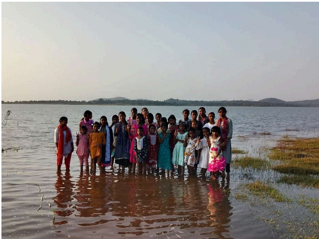
Les filles de Bakuabari et d'Asansol dans la rivière à proximité du foyer