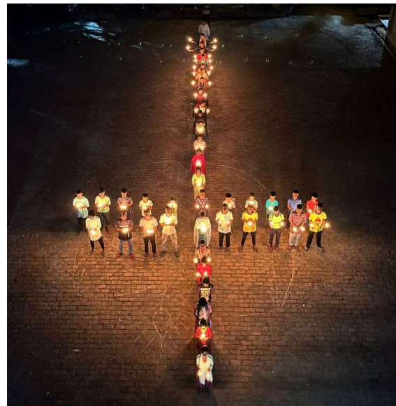
Célébration de Diwali au foyer de Baksara